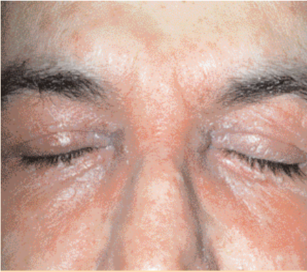
Een vrouw met contactallergie.